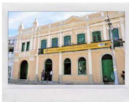
CIDADE DA CRIANÇA

ARRASTE OS NOMES AOS PONTOS TURÍSTICOS DE NOSSA CIDADE.