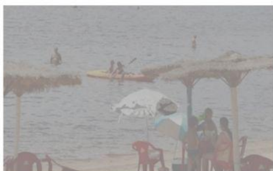
LAGOA DE CIMA