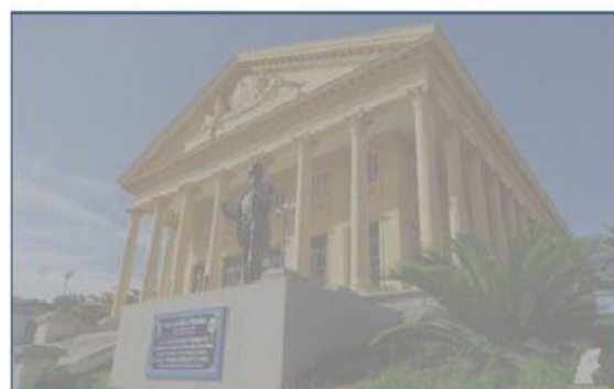
CÂMARA DOS VEREADORES