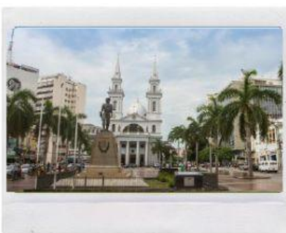
FAROL DE SÃO TOMÉ