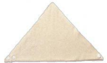
FABRIC & WATERPROOF PLASTER