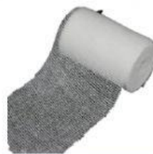
PEMBALUT TIGA SEGI / ANDUH