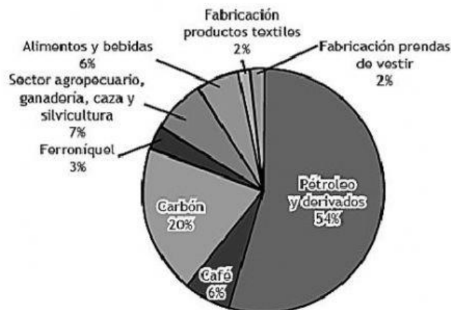
Porcentaje de exportaciones de Colombia por producto en 2020

21. Según la gráfica, se puede concluir que las exportaciones colombianas se concentran en el