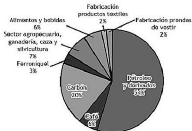
Porcentaje de exportaciones de Colombia por producto en 2020

23. Según la gráfica, se puede concluir que las exportaciones colombianas se concentran en el