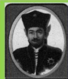
Gambar 6.14. Sultan Agung Hanyakrakusuma

Kerajaan Mataram mencapai puncak kebesarannya pada masa pemerintahan Sultan Agung Hanyakrakusuma (1613-1645 M). Hal itu merupakan cerminan dan kebesaran jiwa, keberanian, keuletan, dan kecakapan serta kuatnya kepribadian Sultan Agung. Ia adalah seorang militer yang ulung, organisator yang berhasil, ahli politik, ahli sastra, ahli filsafat, dan sangat mementingkan urusan agama. Dalam sejarah Islam, Kesultanan Mataram memiliki peran yang penting dalam perjalanan sejarah kerajaan-kerajaan Islam di Nusantara. Hal ini terlihat dan semangat raja-raja untuk memperluas daerah kekuasaannya, dan mengislamkan para penduduk daerah kekuasaannya, hingga mengembangkan