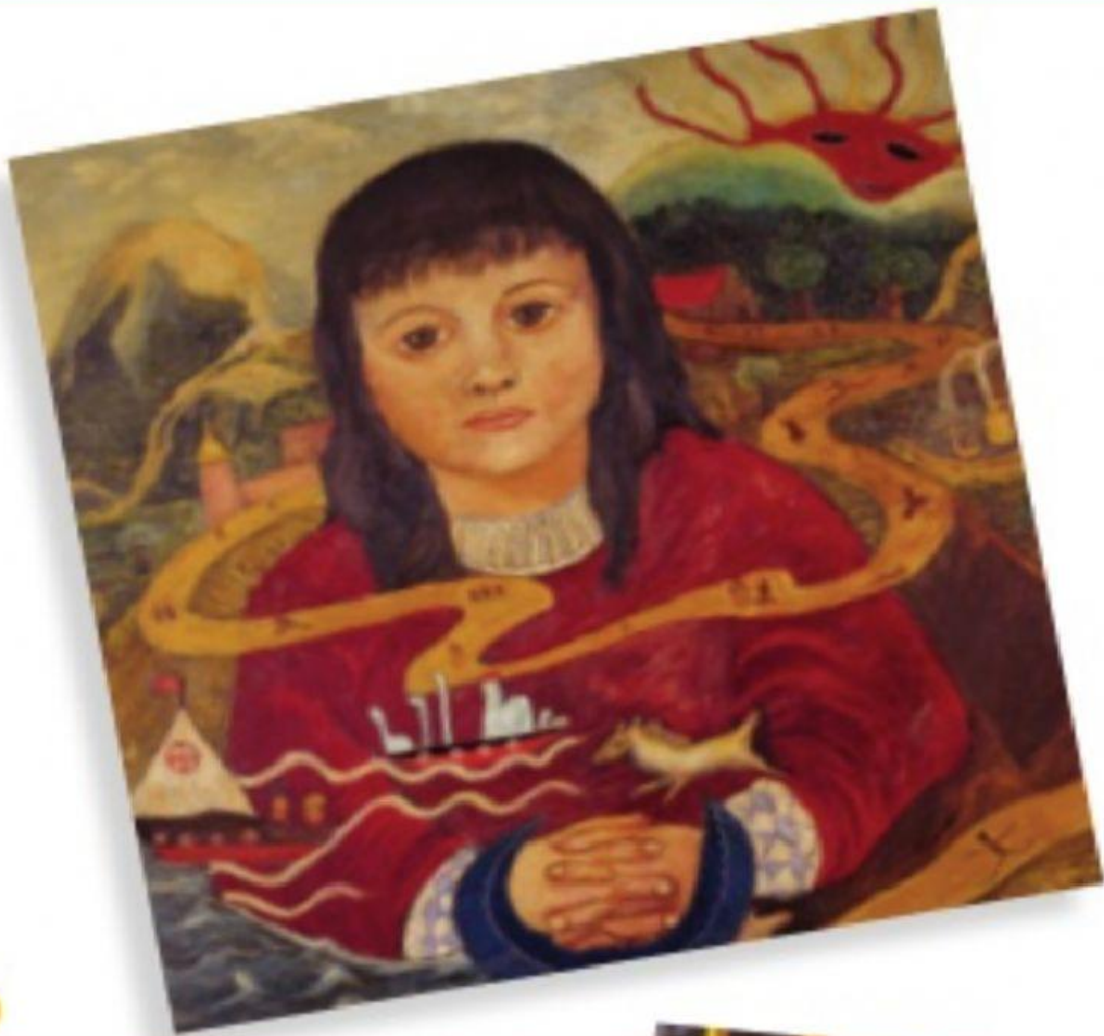
Retrato de Laura, de J. Arellano Fisher (siglo XX)