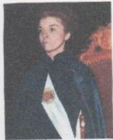
Isabel Martínez de Perón

EL 24 DE MARZO DE 1.976, UNA JUNTA MILITAR SACÓ DEL PODER A LA PRESIDENTA MARÍA ESTELA DE PERÓN.