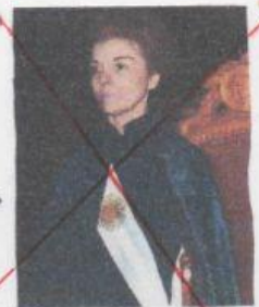
Isabel Martínez de Perón

A PARTIR DE ESE MOMENTO LA JUNTA MILITAR TOMA EL PODER DEL PAÍS Y LE SACA AL PUEBLO ARGENTINO LA POSIBILIDAD DE PODER ELEGIR, TOMAR SUS PROPIAS DECISIONES Y SER LIBRES.