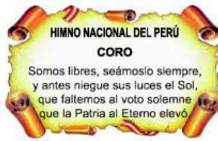
CORO DEL HIMNO NACIONAL