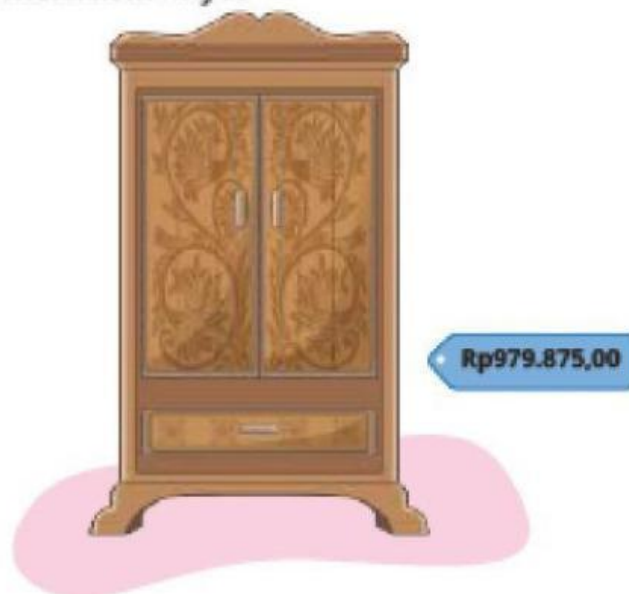
Gambar 9.2 Lemari Jepara

Pada hari Minggu, Nisa mengantar Ibu membeli lemari di Jepara, Jawa Tengah. Jepara merupakan kota di Jawa Tengah yang terkenal dengan produksi mebel. Tahukah kamu? Mebel Jepara terkenal sampai ke mancanegara karena ukiran yang diproduksi oleh pengrajin mebel di sana mempunyai karakteristik yang khas dan kualitas terjamin. Harga mebel yang ada di Jepara beraneka ragam. Nisa memberikan saran kepada ibu terkait lemari yang dipilihnya. Lemari yang dipilih Nisa seharga Rp979.875,00 atau bisa dibaca "sembilan ratus tujuh puluh sembilan ribu delapan ratus tujuh puluh lima rupiah". Pernahkah kalian melihat angka-angka seperti harga lemari tersebut? Apakah kalian masih ingat harga sepatu atau peralatan sekolah serta pakaian kalian? Di manakah kalian menemukan angka-angka lain? Bisakah kalian membaca dan menuliskannya?