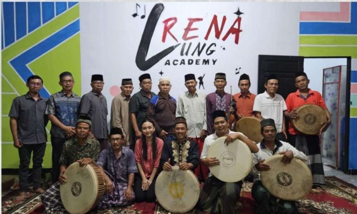
Kebersamaan Penari dendang setelah latihan