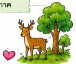
ความสำคัญของชีวภาค