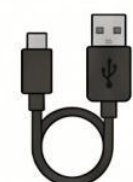
สาย USB (USB Cable)