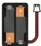
เคสใส่ถ่าน (Battery Holder)

ใช้เป็นแหล่งพลังงานพกพา เพื่อให้บอร์ดทำงานได้โดยไม่ต้องเสียบสายกับคอมพิวเตอร์