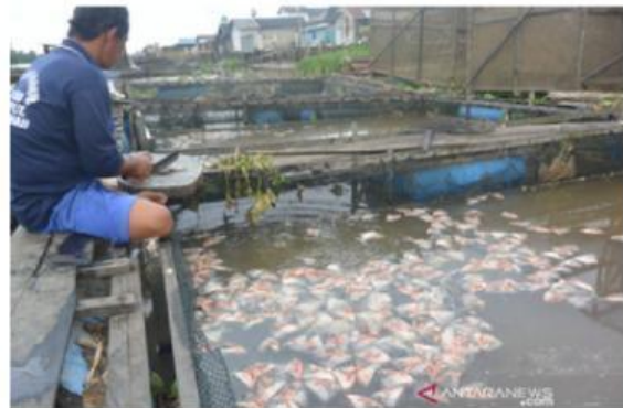
Gambar 1. Kematian puluhan ton ikan

BANJARMASIN – Ratusan pembudidaya ikan keramba di sepanjang bantaran Sungai Martapura menjerit akibat ribuan ikan mereka ditemukan mati massal dalam waktu semalam. Air sungai mendadak berubah coklat kehitaman pekat dan mengeluarkan bau menyengat. Berdasarkan pemeriksaan lapangan Dinas Lingkungan Hidup (DLH), tingkat keasaman (pH) air sebenarnya terpantau normal. Namun, kadar oksigen terlarut (Dissolved Oxygen/DO) anjlok drastis hingga menyentuh angka 2 mg/L (jauh di bawah batas normal). Kondisi miskin oksigen inilah yang menyebabkan ikan mati massal karena kehabisan napas.