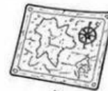
แผนที่โบราณ