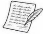
จดหมายเหตุ