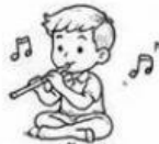
เพลงพื้นบ้าน