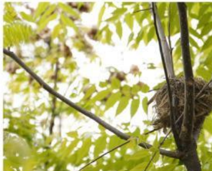
Gambar 8. Sarang Burung di atas Pohon (Yeh, 2023)