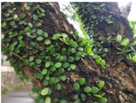
Gambar 7. Benalu dan Inangnya (Lane, 2025)

Perhatikan gambar berbagai interaksi organisme pada suatu ekosistem berikut ini! Pasangkanlah dengan cara menarik kotak jenis interaksi organisme tersebut pada gambar interaksi yang sesuai!