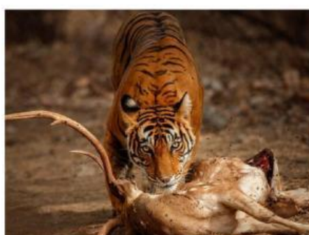
Gambar 11. Harimau Memakan Mangsanya (Firmansyah&Maullana, 2025)