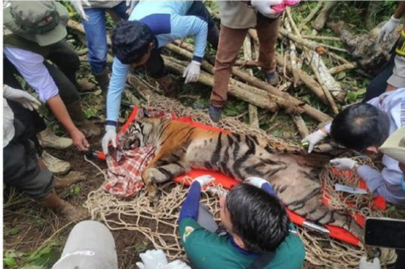
Gambar 6. Seekor Harimau Terkena Jerat (BKSDA Sumbar, 2024)

Hutan-hutan di Sumatera menyimpan keragaman hayati yang luar biasa, tempat berbagai spesies hidup saling terhubung dalam keseimbangan alam yang rapuh. Antara pepohonan tua dan semak yang lebat, hidup satwa-satwa liar yang keberadaannya menjadi penanda kesehatan suatu ekosistem. Salah satu satwa yang sering menjadi simbol kelestarian hutan adalah harimau Sumatra. Keberadaannya mencerminkan bahwa suatu kawasan hutan masih mampu mendukung kehidupan satwa besar dan menjaga proses-proses alami yang terjadi di dalamnya.