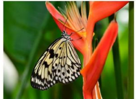
Gambar 9. Kupu-kupu dengan Bunga (Aeni, 2021)