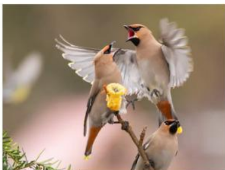
Gambar 10. Dua Ekor Burung Memperebutkan Makanan (Beaudry, 2022)