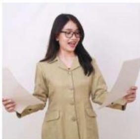
Gambar 1. guru memegang kertas

"Perhatikan kertas yang dipegang oleh bapak/ibu guru. Jika kertas ini dibakar dan berubah menjadi abu, menurut pendapatmu apa yang akan terjadi pada massanya?"