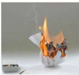
Gambar 2. kertas dibakar