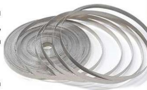
Gambar 3. pita magnesium