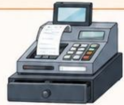
เครื่องบันทึกเงินสด

2.2 ให้นักเรียนยกตัวอย่างสถานการณ์ที่มีการประมวลผลด้วยเครื่องจักรกล 1 สถานการณ์