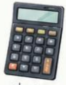
เครื่องคิดเลข

1.2 ให้นักเรียนยกตัวอย่างสถานการณ์ที่มีการประมวลผลข้อมูลด้วยมือ 1 สถานการณ์