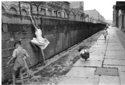
1961 г., Изграждане на Берлинската стена