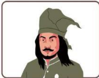
Tuanku Imam Bonjol

Hubungkan gambar pahlawan nasional dengan namanya pada gambar berikut ini!