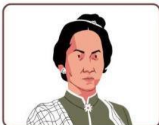
Ki Hajar Dewantara