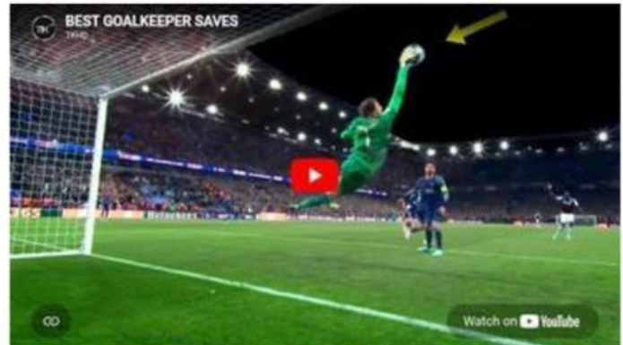
Video 1. Kiper Menangkap Bola https://youtu.be/yxvaURdWJS8?si=WpKwMbKSKjCbclLU