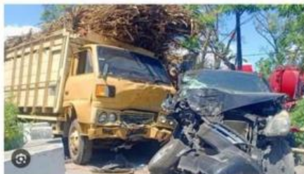
Gambar. 1. 3 Dua mobil saling bertabrakan https://url-shortener.me/5N3G