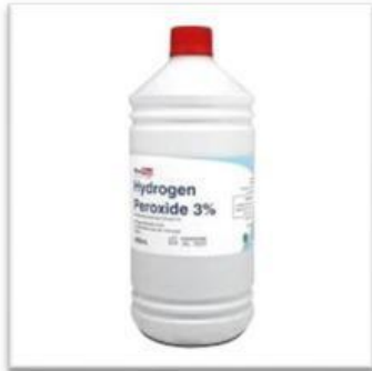
Gambar 1. Hidrogen Peroksida