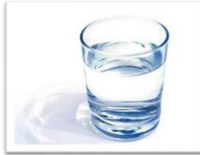
Gambar 2. Air