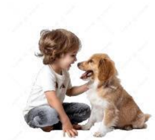
Play with the dog.