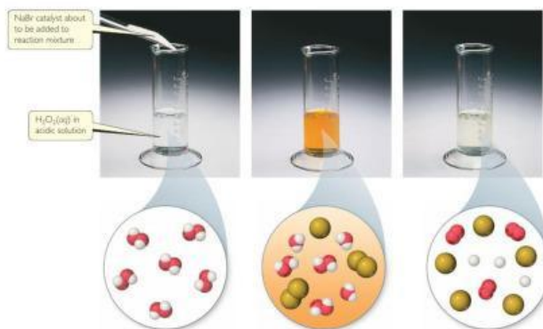
Gambar 12. Pengaruh katalis terhadap hidrogen peroksida menjadi air dan gas oksigen.

Pada kegiatan sebelumnya, Ananda telah menduga bahwa penambahan ragi dapat mempercepat suatu proses perubahan. Lalu, bagaimana suatu zat dapat mempercepat laju reaksi tanpa ikut habis bereaksi? Untuk lebih memahami perhatikan gambar 12 di bawah ini!!