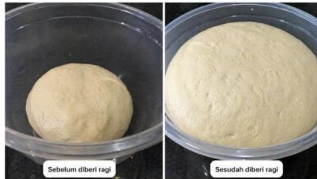
Gambar 11. Perbedaan ukuran pada adonan roti

Dalam kehidupan sehari-hari, terdapat berbagai proses perubahan yang dapat berlangsung dengan kecepatan berbeda-beda.