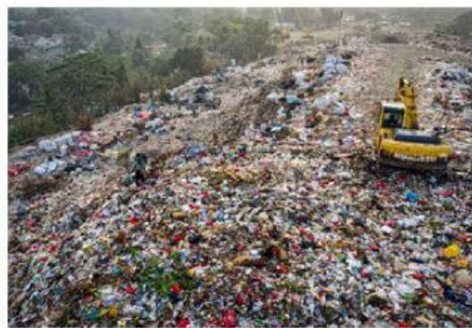
Gambar 2. Sampah Plastik

Bacalah wacana berikut dengan saksama, kemudian identifikasi permasalahan yang berkaitan dengan materi polimer.