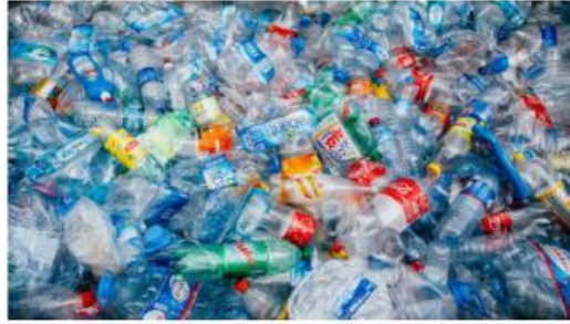
Gambar 1. Sampah Plastik

Polimer merupakan senyawa makromolekul yang tersusun atas unit-unit kecil yang disebut monomer. Monomer-monomer tersebut bergabung melalui proses polimerisasi sehingga membentuk rantai molekul yang panjang dan kompleks. Berdasarkan proses pembentukannya, polimer dibedakan menjadi polimer adisi dan polimer kondensasi. Polimer adisi terbentuk dari monomer yang memiliki ikatan rangkap tanpa menghasilkan molekul lain, sedangkan polimer kondensasi terbentuk melalui reaksi antara monomer yang memiliki dua gugus fungsi atau lebih disertai pelepasan molekul kecil, seperti air.