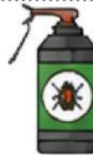
Menyemprot tanaman dengan pestisida