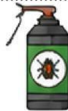
Menyemprot tanaman dengan pestisida