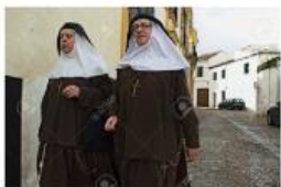
Hermanas de la Cruz (Religiosas)

Es el sucesor de Pedro, el amigo de Jesús, el encargado de guiar a la Iglesia Universal, y el representante de Cristo en la tierra. Él vive en Roma, y desde allí dirige la Iglesia