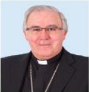
José Ángel Salz Meneses (Arzobispo de Sevilla)