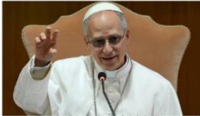
PAPA LEON XIV