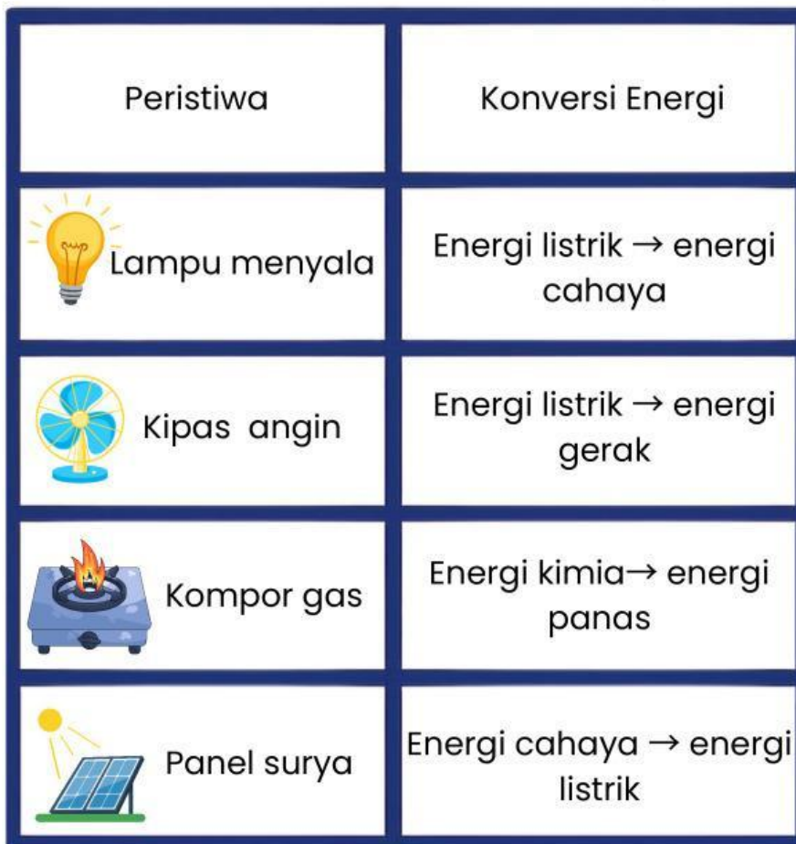
Tabel 1.1 Perubahan Bentuk Energi

Energi adalah daya atau kekuatan untuk melakukan suatu aktivitas atau pekerjaan. Di kehidupan sehari-hari, energi digunakan untuk berbagai aktivitas, seperti menyalakan lampu, mengisi daya telepon genggam, memasak, dan mengoperasikan kendaraan. Dalam fisika, energi merupakan besaran yang secara langsung tidak kelihatan. Hukum kekekalan energi berbunyi "Energi tidak dapat diciptakan atau dihancurkan, namun dapat berubah bentuk". Perubahan bentuk energi tersebut disebut konversi energi.