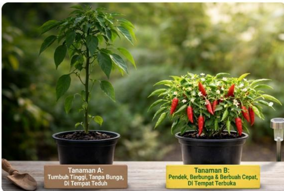
Tanaman A: Tumbuh Tinggi, Tanpa Bunga, Di Tempat Teduh