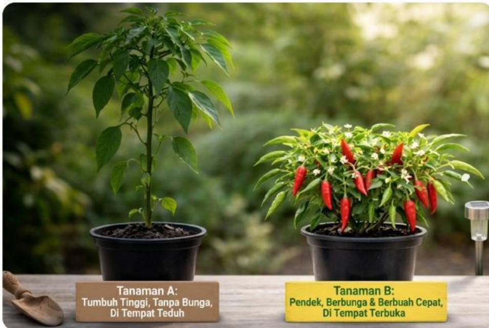
Tanaman A: Tumbuh Tinggi, Tanpa Bunga, Di Tempat Teduh