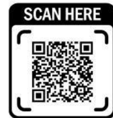
Inovasi Pengelolaan Sampah

Berdasarkan narasi vidio diatas, perhatikan lingkungan kelas atau sekolahmu. isilah tabel analisis dibawah ini untuk memetakan bagaimana kamu bisa memanfaatkan sumber daya yang ada disekitarmu agar tidak berakhir menjadi limbah yang tidak berguna!