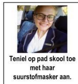
Teniel op pad skool toe met haar suurstofmasker aan.