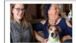
Teniel en Alta tydens die onderhoud.

[Vertaal en aangepas uit Weekend Post , Saterdag, 28 Desember 2019.]