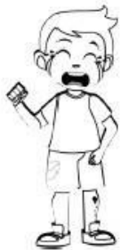
โดนเพื่อนแกล้ง