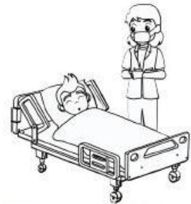
แจ้งคุณครู ผู้ปกครอง พบแพทย์