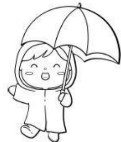
สวมชุดกันฝนกางร่ม