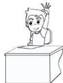
ตั้งใจเรียน