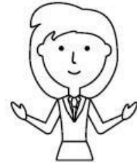
แจ้งคุณครู