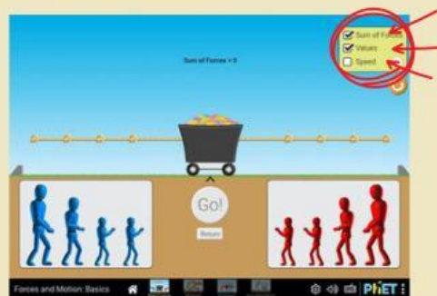
Gambar 1. 5 Tools Sum of Forces dan Values