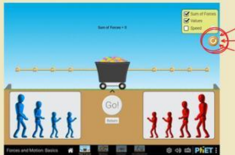
Gambar 1. 6 Tools reset