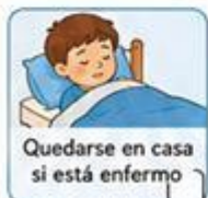
Quedarse en casa si está enfermo