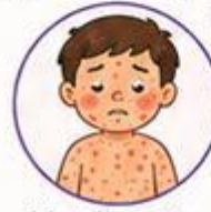
Manchas rojas en la piel