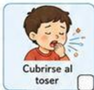
Cubrirse al toser