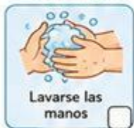
Lavarse las manos