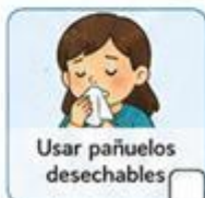
Usar pañuelos desechables