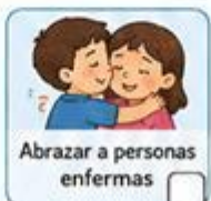
Abrazar a personas enfermas