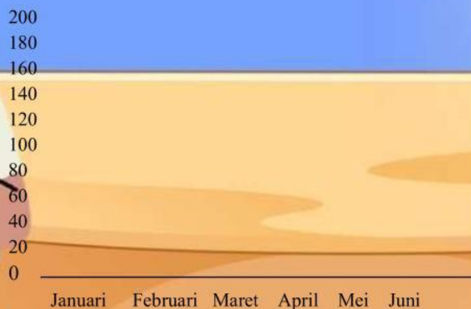
Diagram Garis: Penjualan Buku Koperasi Sekolah 2025

(Lengkapi diagram garis di atas sesuai gambar yang tersedia disamping)