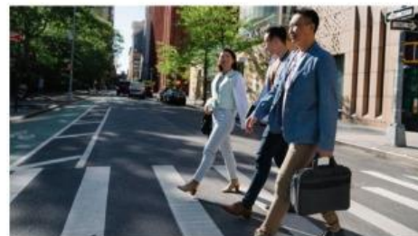
Gambar 18. Orang sedang berjalan

Seperti yang kita ketahui, dalam kehidupan sehari-hari terdapat aktivitas yang berlangsung dengan kecepatan yang berbeda-beda. Kecepatan seorang sprinter dapat dinyatakan dalam satuan meter per detik, sedangkan kecepatan orang berjalan dapat dinyatakan dalam satuan meter per menit. Dalam reaksi kimia, suatu proses juga dapat berlangsung dengan kecepatan yang berbeda-beda. Menurut pendapatmu, apakah laju reaksi dipengaruhi oleh konsentrasi pereaksi atau konsentrasi hasil reaksi?