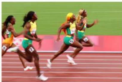
Gambar 17. Sprinter sedang berlari

Gambar 17 menunjukkan sprinter yang sedang berlari, sedangkan gambar 18 menunjukkan orang yang sedang berjalan. Perhatikan perbedaan kecepatan gerak pada kedua aktivitas tersebut. Menurut pengamatanmu, aktivitas manakah yang menunjukkan gerakan lebih cepat?