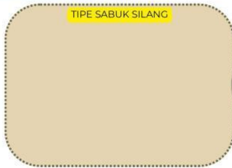
TIPE SABUK SILANG

https://www.youtube.com/watch?v=0v-YyDTxl-E