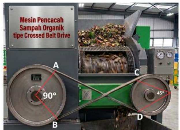
Mesin Pencacah Sampah Organik Tipe Sabuk Silang

Pulley (atau katrol) adalah roda dengan alur di sekelilingnya yang digunakan bersama tali, rantai, atau sabuk (belt).