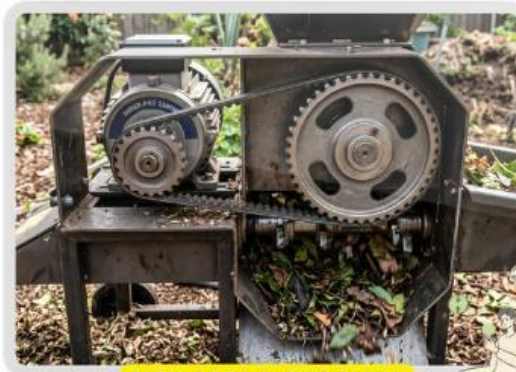
TIPE SABUK TERBUKA