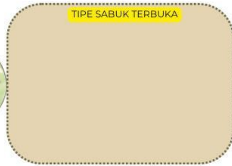
TIPE SABUK TERBUKA

https://www.youtube.com/watch?v=0v-YyDTxl-E