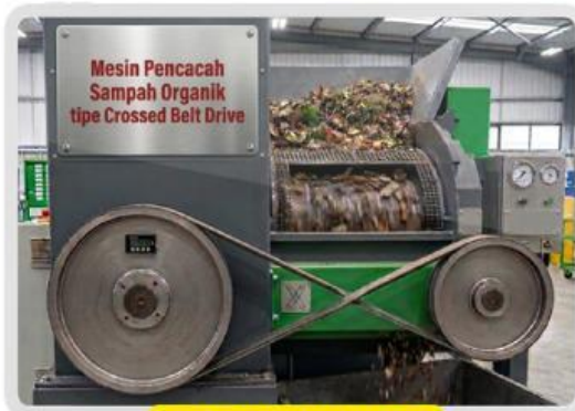
TIPE SABUK SILANG

Sebuah sekolah Adiwiyata berencana membeli mesin pencacah sampah setelah mempertimbangkan beberapa hal berikut: