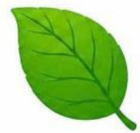
Lá cây xanh lá