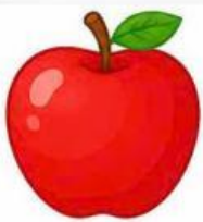
Quả táo đỏ