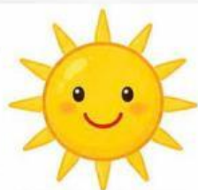
Mặt trời vàng