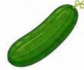
quả dưa chuột