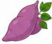
củ khoai lang