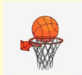
My Basket Ball