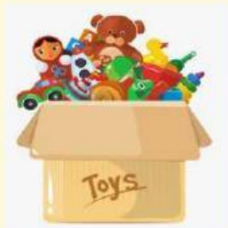
My favorite toy

Describe one object that is special to you. You can describe colour, size, condition, function, why it is important.