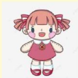
My Pretty Doll