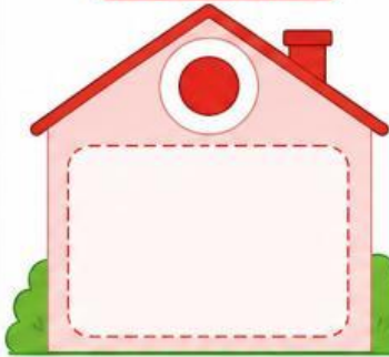
NHÀ HÌNH CHỮ NHẬT