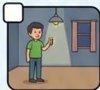
LAMPU MENYALA SAAT TERANG