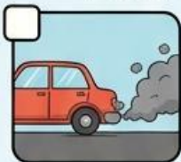
MOBIL PRIBADI PRIBADI BERASAP