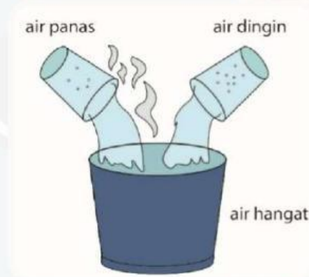
Gambar (2) Percampuran air dingin dan air panas