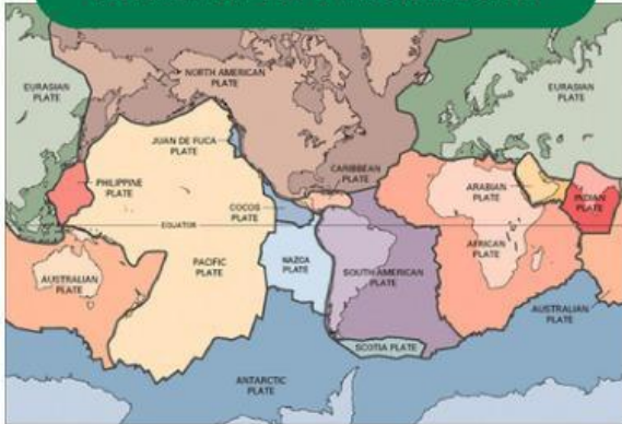
PETA LEMPENG TEKTONIK DUNIA