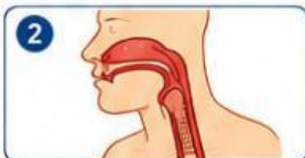
Udara menuju tenggorokan