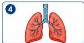
Udara sampai ke paru-paru