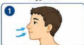
Udara masuk melalui hidung