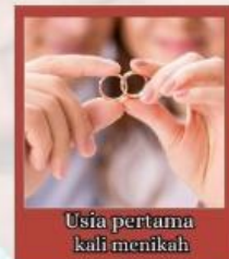
Usia pertama kali menikah