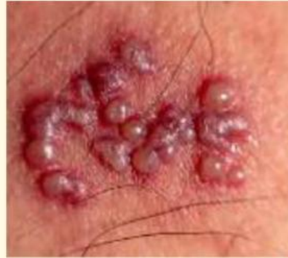
GAMBAR 3. INFEKSI MENULAR SEKSUAL (IMS) (MATERNITAS DKK., 2019)

PENYAKIT AKIBAT BAKTERI, VIRUS, ATAU PARASIT YANG MENULAR MELALUI HUBUNGAN SEKSUAL, SEPERTI GONORE, KLAMIDIA, DAN SIFILIS. INFEKSI INI DAPAT MENYEBABKAN RADANG PANGGUL (PID), NYERI PANGGUL, KEPUTIHAN ABNORMAL, DAN JIKA TIDAK DIOBATI, RISIKO INFERTILITAS DAN KEHAMILAN EKTOPIK MENINGKAT. PENCEGAHAN DAPAT DILAKUKAN DENGAN SEKS AMAN DAN PEMERIKSAAN DINI.