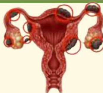
GAMBAR 2. GANGGUAN ENDOMETRIOSIS (MATERNITAS DKK., 2019)

KONDISI DI MANA JARINGAN ENDOMETRIUM YANG SEHARUSNYA MELAPISI RAHIM MALAH TUMBUH DI LUAR RAHIM, SEPERTI DI OVARIUM, SALURAN TUBA, ATAU RONGGA PANGGUL. ENDOMETRIOSIS MENYEBABKAN NYERI HAID PARAH, PERDARAHAN BERLEBIH, INFERTILITAS, DAN NYERI PANGGUL KRONIS. PENYEBAB PASTINYA BELUM JELAS, TAPI KEMUNGKINAN ADANYA FAKTOR GENETIK DAN SISTEM IMUN YANG ABNORMAL.