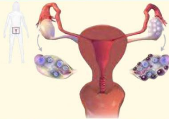
GAMBAR 1. GANGGUAN SINDROM OVARIUM POLIKISTIK (PCOS) (MATERNITAS DKK., 2019)

PCOS ADALAH GANGGUAN HORMONAL YANG MENYEBABKAN OVARIUM MENGHASILKAN HORMON ANDROGEN (HORMON PRIA) DALAM JUMLAH BERLEBIH. AKIBATNYA, FOLIKEL DI OVARIUM TIDAK BERKEMBANG SEMPURNA DAN MEMBENTUK BANYAK KISTA KECIL. WANITA DENGAN PCOS MENGALAMI MENSTRUASI TIDAK TERATUR, PERTUMBUHAN RAMBUT BERLEBIH, JERAWAT, DAN KESULITAN HAMIL. FAKTOR PENYEBABNYA TERMASUK GANGGUAN HORMONAL, GENETIK, OBESITAS, DAN GAYA HIDUP.