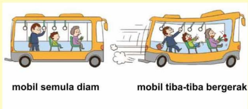
Gambar 2. Mobil di gas secara tiba-tiba