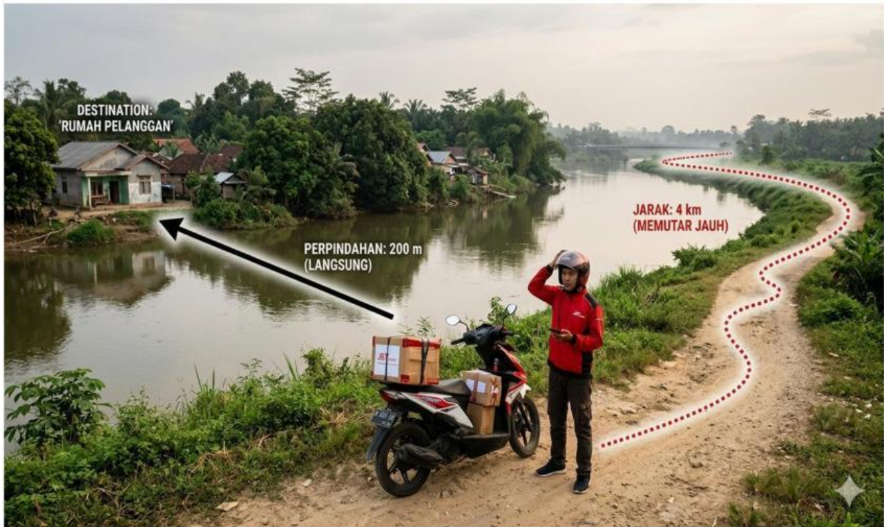
Gambar 1 Kurir Pengantar Paket

Perhatikan Gambar 1 yang ditampilkan oleh Guru dibawah ini !