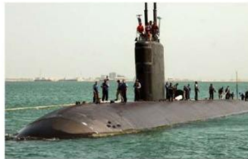
Gambar 2.2 Kapal Selam