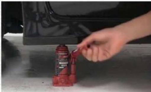
Video 2.1 Dongkrak Hidrolik

Dalam kehidupan sehari-hari, terdapat berbagai alat dan fenomena yang memanfaatkan prinsip fluida. Fenomena tersebut dapat diamati melalui video berikut yang menampilkan penggunaan dongkrak hidrolik dan pergerakan kapal selam di dalam air.