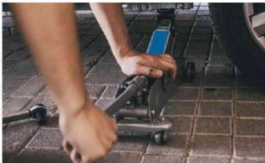
Gambar 2.1 Dongkrak Hidrolik

Perhatikan video berikut yang menampilkan cara kerja dongkrak hidrolik dan kapal selam. Amatilah setiap fenomena yang terjadi dengan saksama, kemudian identifikasi hal-hal yang menurutmu menarik atau perlu dijelaskan lebih lanjut.