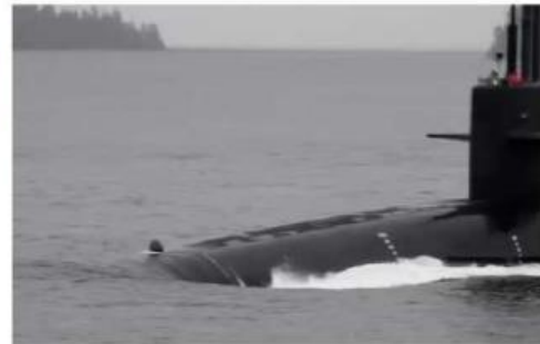
Video 2.2 Kapal Selam